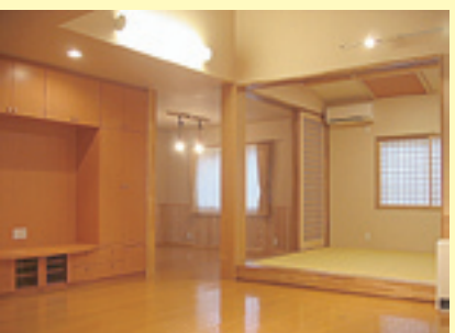
広々としたリビング

私たち家族は、3人の子供たちもそれぞれに就職し自分たちの道を歩き始め、それとともに家族構成や時代の変化に合った便利で今以上に過ごしやすい家で暮らしたいと考えはじめ、長年暮らしてきた家の建替えを考え始めました。週末になるとたくさんの建築業者・工務店の内覧会のチラシが新聞折込等で届きますので、見学に出掛けるのが私たち夫婦の楽しみになっていました。渋谷工務店に改築を依頼してからは、担当の方から、ショールームや今建築中の現場で基礎や構造の部分から壁や床材などの説明をいただき要望を伝えイメージとおりに進んでいきました。リビングは日差しが入る明るい場所に、キッチンには収納力があり、脱衣室・浴室は広くゆっくり寛げるように、寝室も落ち着ける静かな空間にしたい、等よく話し合ってきました。始めはオール電化住宅には興味がなかったのですが、IHクッキングヒーターや食器洗浄器の便利でお得な事や、昨年のような長時間の停電があったときでも、前日の夜間電力によって暖房や温水器はそのまま使え暖かいまま過ごせる事を聞き、思い切ってオール電化住宅に決めました。私の家の玄関先には、先代が植えた藤の花が春になると藤棚にきれいに花を咲かせお花見気分を味わえるとても気に入った場所でした。改築のため移動してからは担当の方がよく水をやりに来てくれたので、来年の春に花を咲かせリビングから私たちの目を楽しませてくれることでしょう。これからの時期も家中暖かく過ごせますので、週末などに子供たちが帰ってきて新築した我が家をどんな風に感じるかを楽しみにしています。